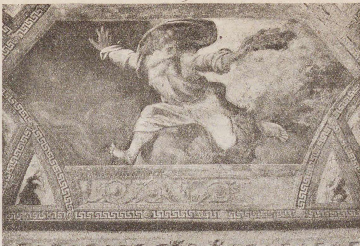
Рафаэль.—И отдѣлилъ Богъ свѣтъ отъ тьмы... („Кн. Бытія“).